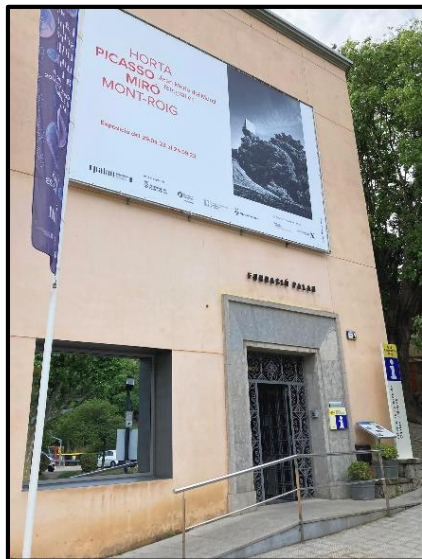
Fundació Palau i Fabre

La frase "El paisatge dels genis" encunyada pel Centre Miró l'any 2008 (i juntament amb el Vendrell-Pau Casals, Gaudí-Reus i Horta de Sant Joan-Picasso) ja eren ben presents (els paisatges), com ara en aquesta preciosa exposició.