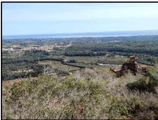
Vista de l'Ermida, Mont-roig, Cambrils i Cap de Salou