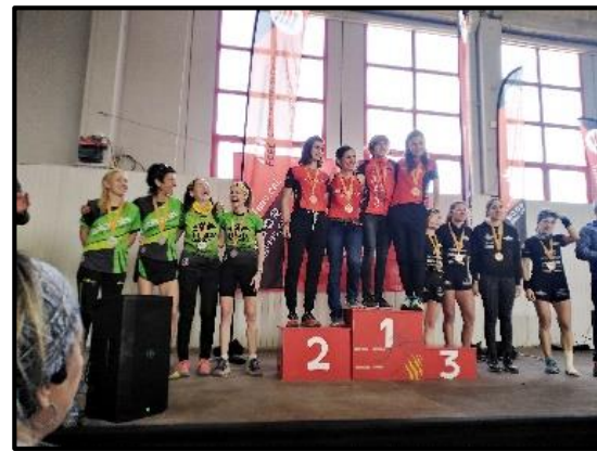
Podi femení del Campionat CAT d'Entitats