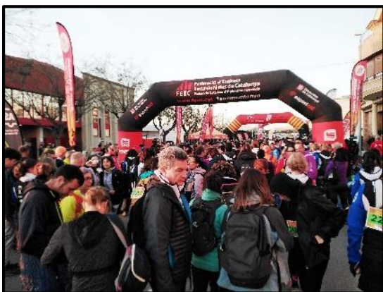
Sortida de la Caminada

També direm que, enguany, a més de corre la X edició de la cursa, ha tingut lloc el Campionat de Catalunya per Entitats i que estem molt satisfets perquè el nostre CE l'Areny ha estat segon en aquesta cursa del passat diumenge 18 de febrer. També direm que la cursa de Trail (21 km) tingué la sortida a la veïna localitat del Prat (Pratdip, oficialment) i que fou molt ben acollida per la seva població. No cada dia, al Prat, hi ha una invasió d'atletes per participar en una esplèndida cursa atlètica com aquesta.