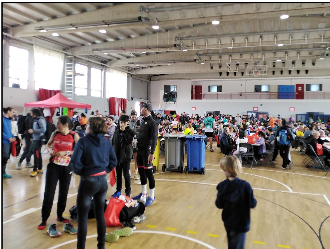
Vista general del poliesportiu, esmorzant

CAMPIONAT DE CATALUNYA D'ENTITATS PER EQUIPS. La prova del Campionat era la cursa Trail , de 21 km i que sortia del Prat (Pratdip) fins a Mont-roig. També direm que la FEEC va donar al CE l'Areny l'organització d'aquesta prova única del Campionat de Catalunya d'Entitats per equips (masculí i femení, 4 atletes per equip) a Mont-roig. El resultat fou. Femení: 1r AE Matxacuca de Sta. Cristina d'Aro. 2n Club Excursionista Uecanoia d'Igualada i 3r Centre Excursionista Solsonès de Solsona. Masculí: AE Matxacuca, 2n CE l'Areny i 3r Club Centre Excursionista Trencacims de Pauils.