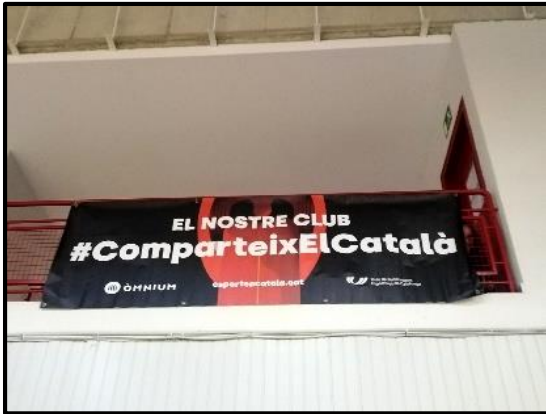
Pancarta d'Òmnium al poliesportiu

Dir també que, al web del CE l'Areny, hi trobareu totes les dades, classificacions, fotos i tot el referent a la X Cursa dels 4 Termes. Ressò mont-roigenc només recordarà els 3 primers de cada cursa i alguns primers corredors locals del CE l'Areny.