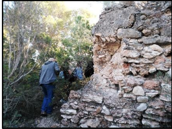
Paret de Miramar, plena de vegetació