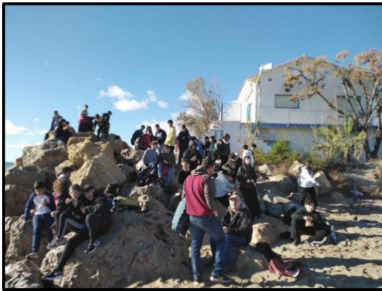
Esmorzant a la platja tocant Casa Ortiz