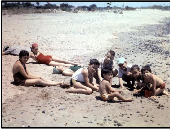
Estat de la platja el 1957