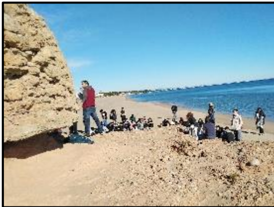
Xerrada al niu de metralladores, a l'Estany SALAT, NO gelat