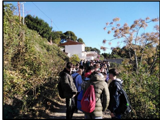
L'INS cap a Miramar, al fons, el xalet del mateix nom