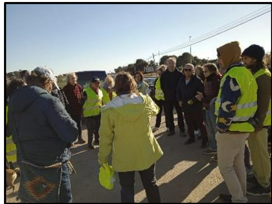
Xerrada informativa dels voluntaris