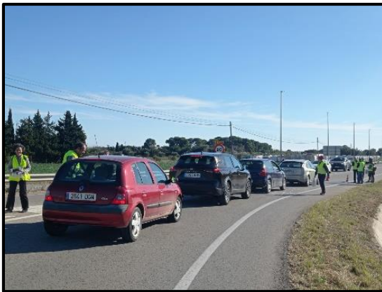
Voluntaris de la PDM informant els conductors