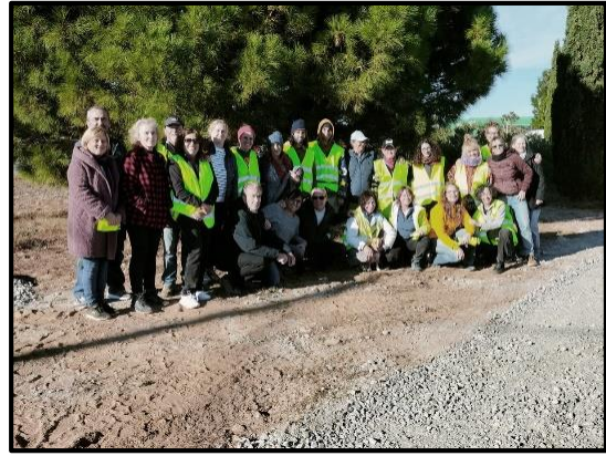
Grup de Mont-roig a la T-323..