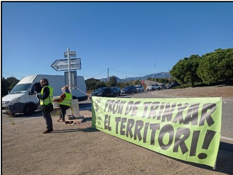
Una de les pancartes a la rotonda del Mas Miró