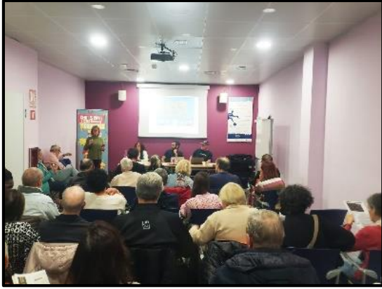
Xerrada informativa a Cambrils