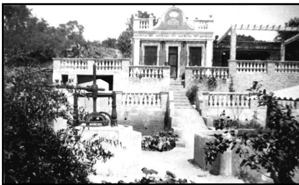
"Casal Miramar" (inici anys cinquanta)

Quan ho recordo, tinc la temptació de creure que ho he somiat o ho he vist en alguna pel·lícula. Deuria ser cap a finals dels anys cinquanta, jo tenia prop de deu anys; aleshores, quan la mare veia una barca de Cambrils pescant davant del xalet, i relativament a la vora de la platja, em deia: "corre i crida'ls!". Jo, "cametes ajudeu-me" cap a la mar. Poc després arribava la mare. Llavors aquells pescadors s'apropaven al