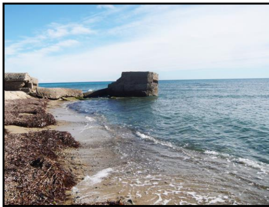
Nius de metralladores (actualment)