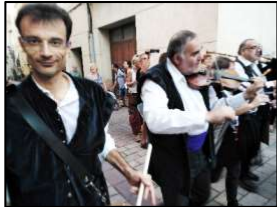
La Kobla d'en Taudell actuant al c/d'Amunt. Apa, no crec que al paràsit Gran Xuxard ni equip de govern li agradi massa