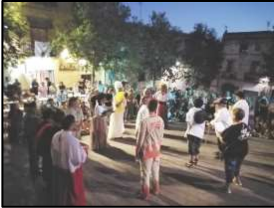
Dames i Vells a la plaça de Joan Miró.