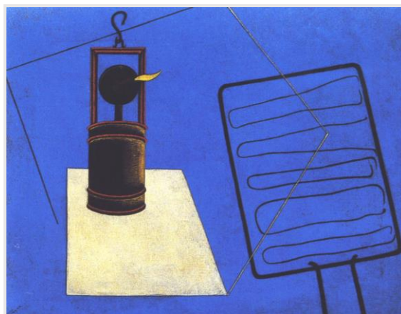
“Natura morta II (el llum del carbur)” Joan Miró (1922-1923)