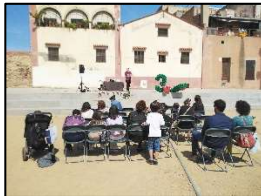
Espectacle per a infants