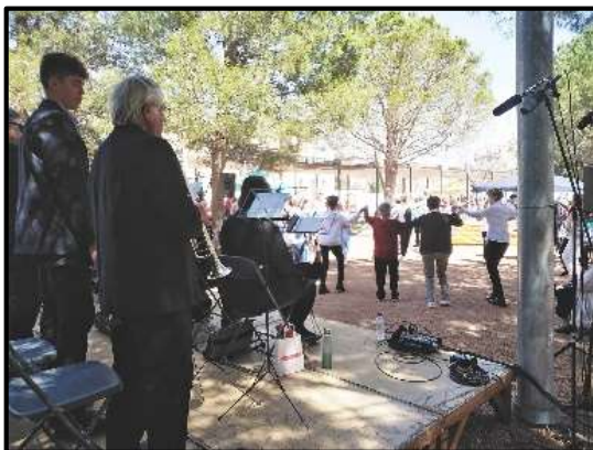
La Cobla La Ràpita en l'audició de sardanes

A mig matí es lliuraren els premis del concurs dels Súper Lectors de la biblioteca Joan Miró. Sensedrama Teatre oferí l’espectacle Sant Jordi i la Cobla La Ràpita oferí una audició de sardanes ballades per la Rotllana Mont-rogenca i tothom que en volgué ballar. A l’ensem, es feia intercanvi de llibres, cosa ben interessant i pràctica. La Coral Sant Miquel ens oferí un petit concert, com ja expliquem al web de Ressò , en un escrit a part.