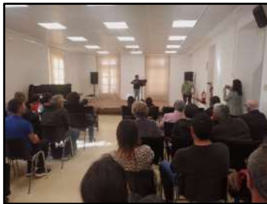
Vista general de la Sala Cinto Quadrus a la Casa de Cultura