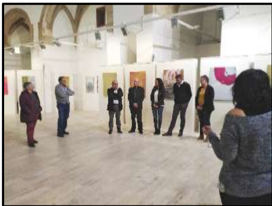
Vista general de l'Església Vella en la inauguració

L'esmentada exposició es podrà visitar, en horari habitual de l'Església Vella, fins al 24 de maig, data de la cloenda i compta amb la col·laboració de l'Ajuntament de Mont-roig i la Fundació Mas Miró.