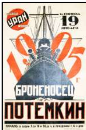
“El cuirassat Potemkin”