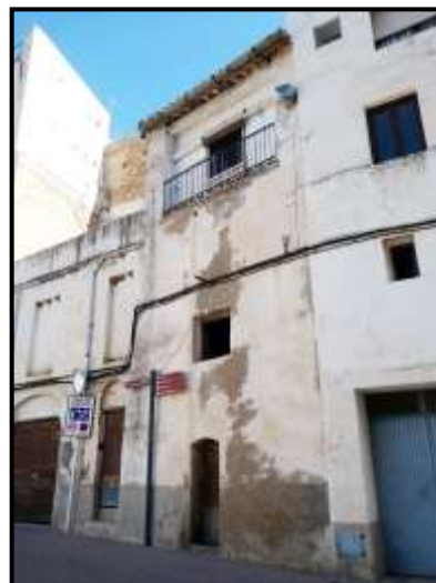
Carrer de la Mare de Déu de la Roca núm. 8