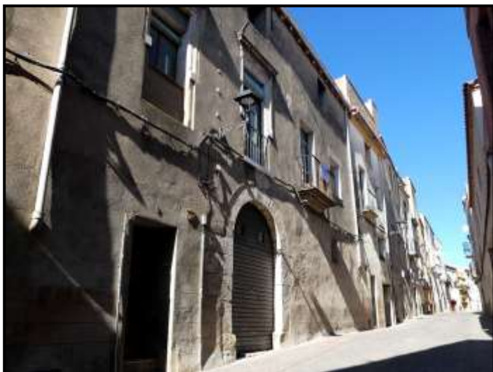
Carrer d'Amunt núm. 9

fent veïnatge pels darreres amb la Murada i una altra a l'avinguda de Reus, a la vora de cal Dominguet de la Cabrera”.