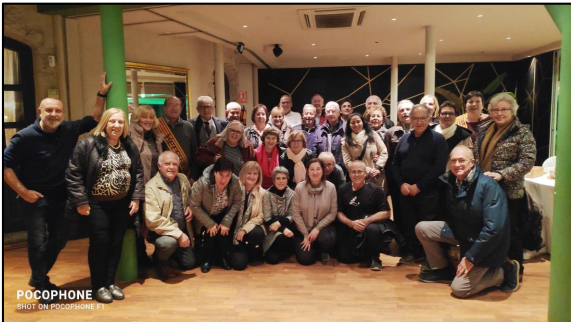
La Quinta del 1957 amb diverses parelles

Des de Ressò mont-rogenç , els volem desitjar una llarga i feliç jubilació. Per molts anys!!