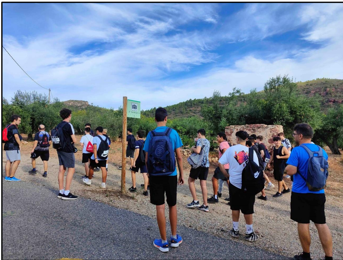
El grup al Peiró esgarrat