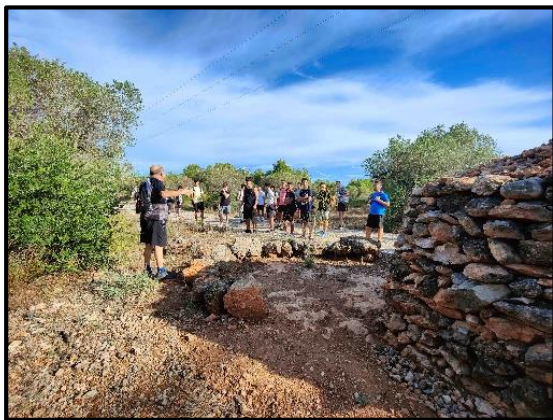
Explicacions sobre la cisterna reformada fa poc

En fi, fou una excel·lent jornada d'activitat física, social, pedagògica i de coneixença mútua, on vam anar explicant l'entorn així com responent les preguntes que anaven sorgint com més s'avançava pel terme i l'excursió programada.