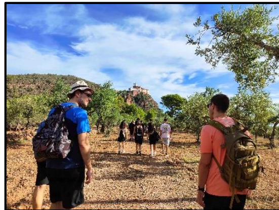
Cap a esmorzar a l'Hort de l'Ermita