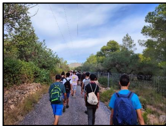
Camí Boverals i Ranclaver