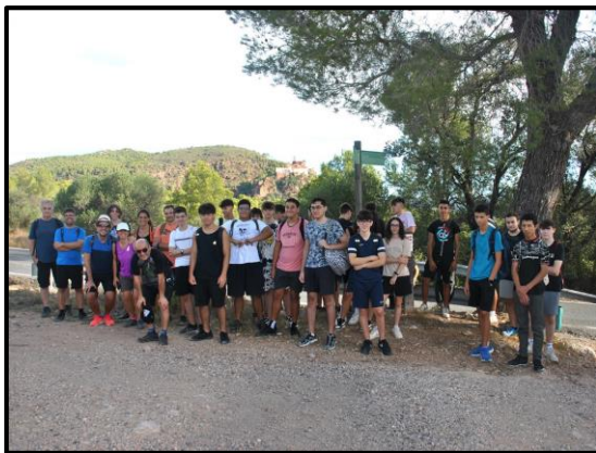
Gairebé tot el grup de l'IAB, al camí de les Guixeres

Vam caminar i conèixer un molt interessant itinerari, tot passant pel camí dels Boverals i la Ranclaver, camí de les Guixeres, camí vell de Colldejou-Falset, l'Hort de l'Ermita (on vam esmorzar), la cova d'en Patou, el sender dels Carlins, el camí de les Parellades, el barranc de la Mina de les Nines, els Rentadors, plaça de Joan Miró, la de Miramar i retorn a l'Institut Antoni Ballester, mont-rogenic de qui enguany celebrem el centenari del seu naixement (va néixer el 1920, però la pandèmia ho va fer ajornar fins enguany).