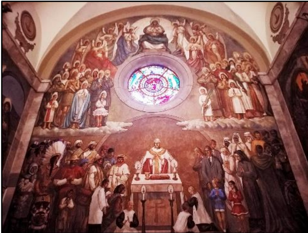
Sta. Maria de l'Alba, Tàrrega