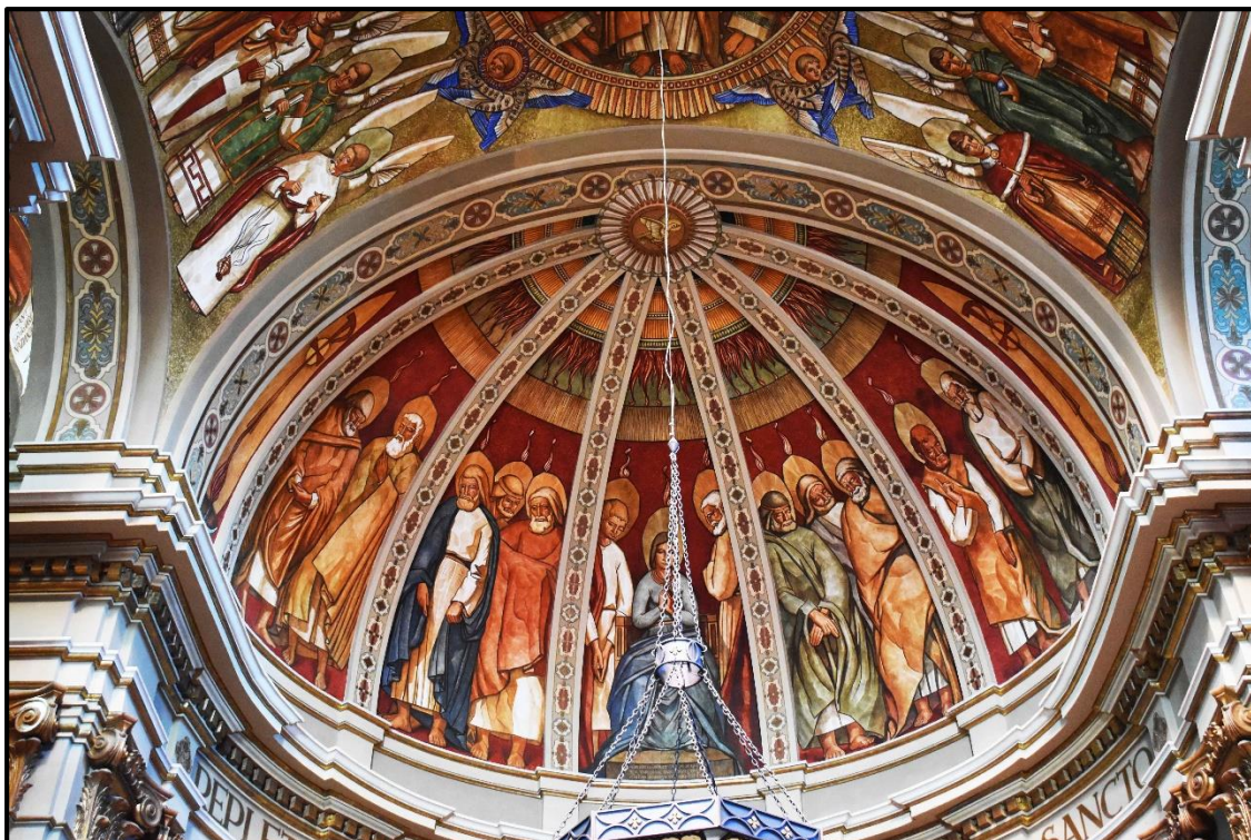
Església de Sant Miquel (Mont-roig)