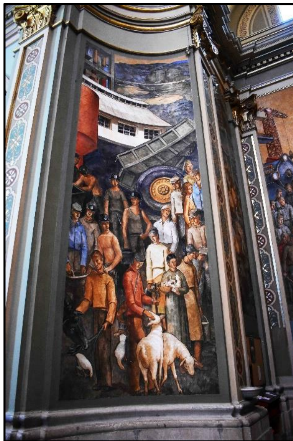
Església de Sant Miquel (Mont-roig)