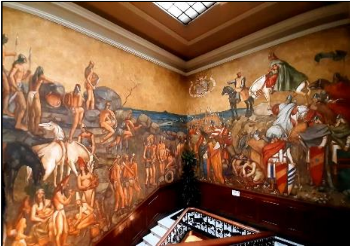
Palau de la Diputació, Lleida