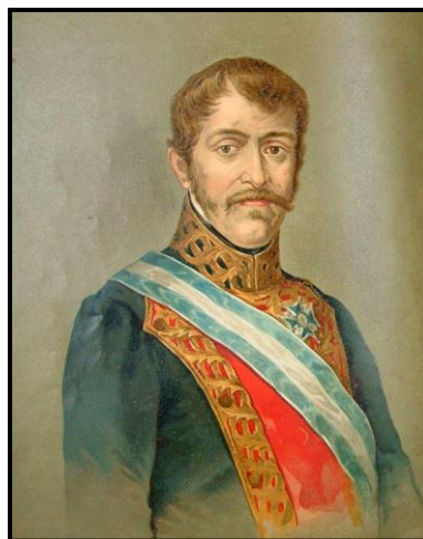
Don Carlos (Carlos V)