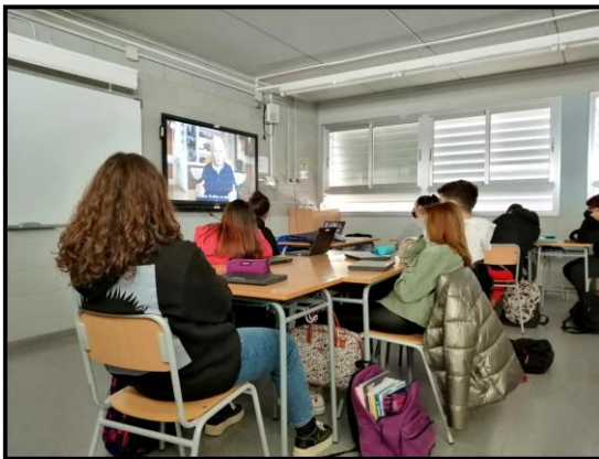
1r ESO. Alumnes treballant per a l'exposició