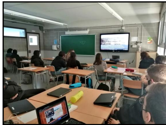
4t ESO. Alumnes treballant per a l'exposició