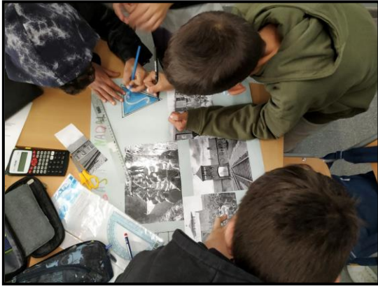
Alumnes treballant en l'exposició