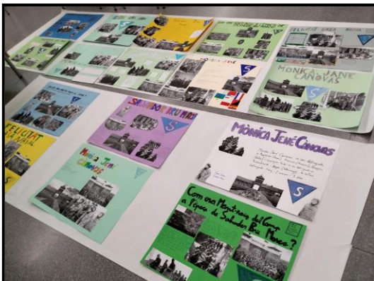
Detall de l'exposició