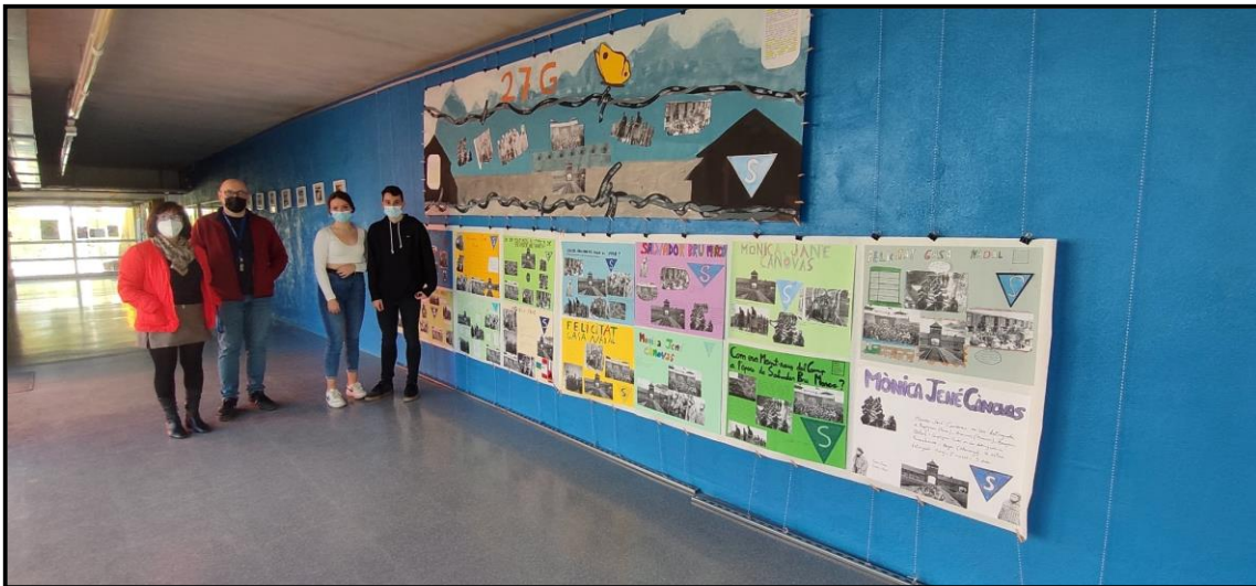
L'exposició als corredors de l'IES