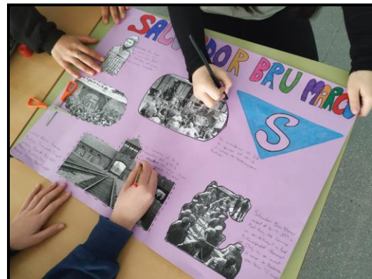
Detall de l'exposició