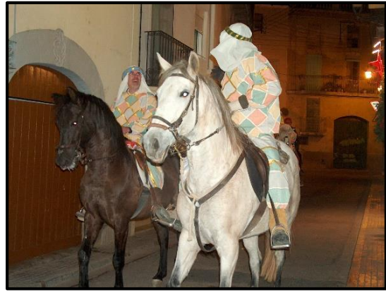
Patges a cavall pel carrer Reial 2005