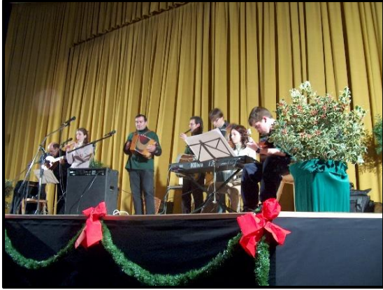
Concert de Reis Kobla d'en Taudell i D'Un Roig Encès a cal Panadero 2005