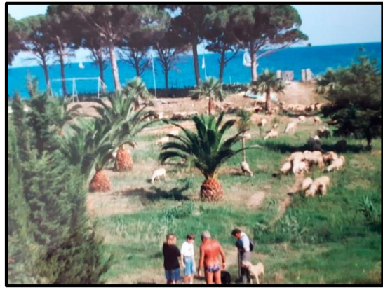
Abans de la construcció de la casa