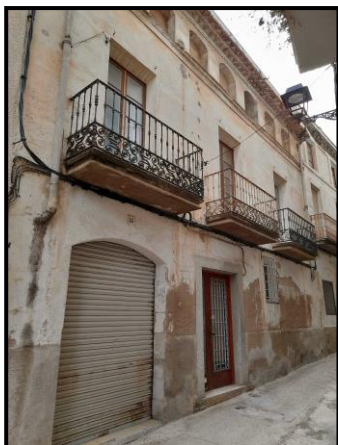
Bisbe Macià núm. 15