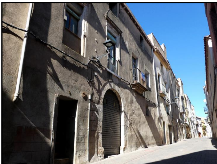
Carrer d'Amunt núm. 9

fent veïnatge pels darreres amb la Murada i una altra a l'avinguda de Reus, a la vora de cal Dominguet de la Cabrera”.