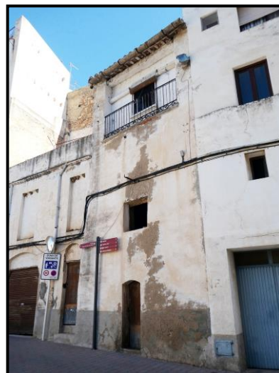
Carrer de la Mare de Déu de la Roca núm. 8