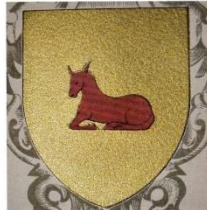
Escut de l'arquebisbe Berenguer de Vilademali, reproduït per A. Saló a l'Armerial de les arcebispes de Tarragona, de J. Gramont.