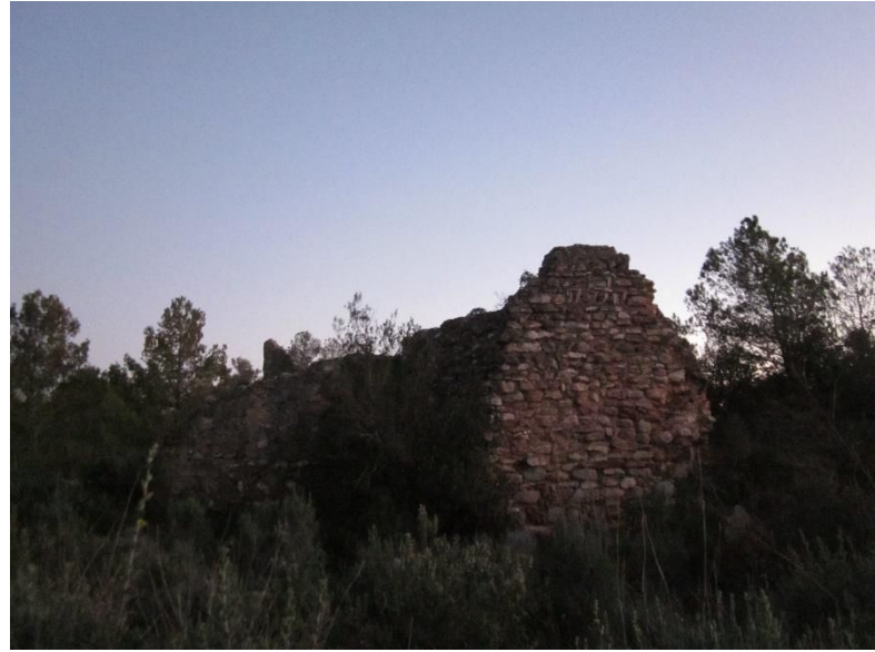
Estat actual de les parets que queden dempeus