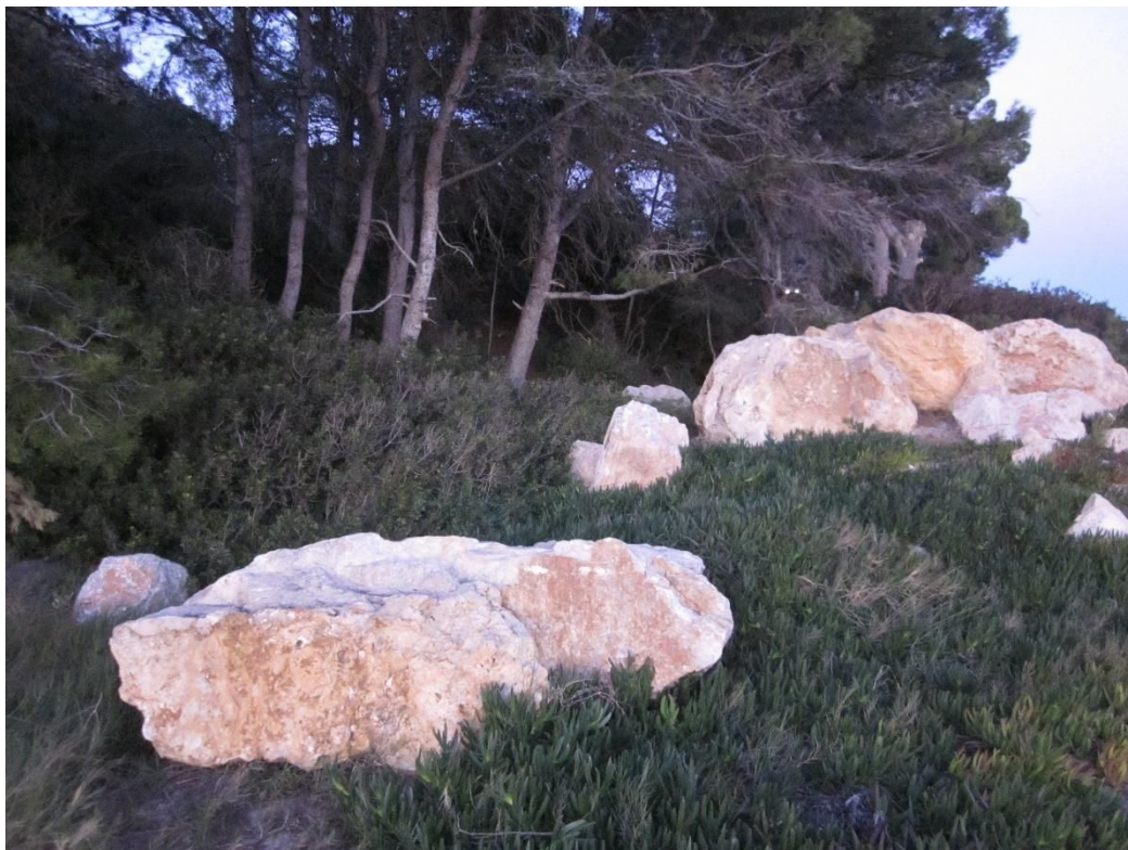
Pedres caigudes damunt l'arena