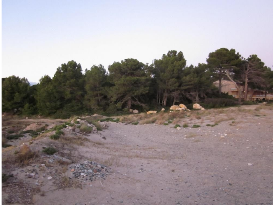
Vista des del mar del lloc on es troben les ruïnes de Miramar