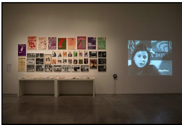
Sala del Museu Reina Sofia

En el documental hi ha imatges del primer míting feminista que es va fer a Barcelona.