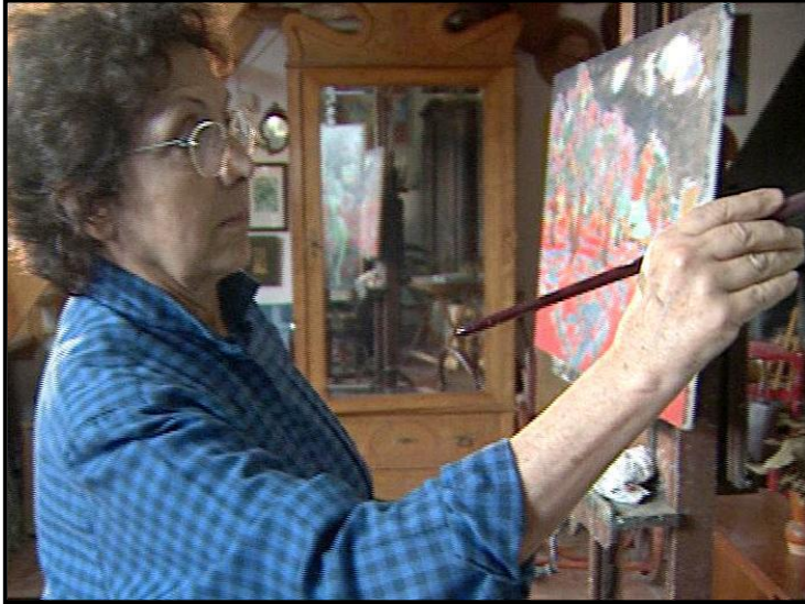
Imatge del documental