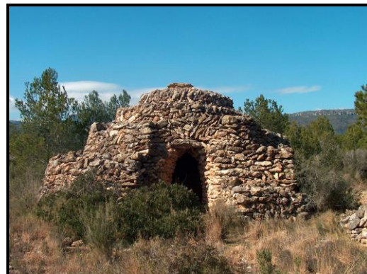
Barraca de l'Espiral

Aquest llarg treball sobre les barraques de pedra seca de Mont-roig es va iniciar el 2004. Des d'aleshores les diverses activitats es poden resumir en: documentació de 135 barraques en bon estat de conservació, publicació d'aquestes informacions a "Ressò Mont-roigenc" (del núm. 91 al 116, i del 125 al 131), publicació d'un tríptic informatiu