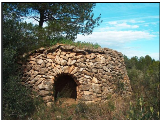
Barraca dels lliris

Aquest llarg treball sobre les barraques de pedra seca de Mont-roig es va iniciar el 2004. Des d'aleshores les diverses activitats es poden resumir en: documentació de 135 barraques en bon estat de conservació, publicació d'aquestes informacions a "Ressò Mont-roigenc" (del núm. 91 al 116, i del 125 al 131), publicació d'un tríptic informatiu