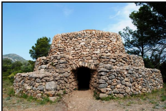
Barraca del Jaume de la Cota

9/1993 DOGC 1807 11/10/1993 Art. 17). Finalment, l'Ajuntament va aprovar en el Plenari del 28-05-2008 que fossin "Bé Cultural d'Interès Local" (BCIL), amb la qual cosa augmentava el seu nivell de protecció.