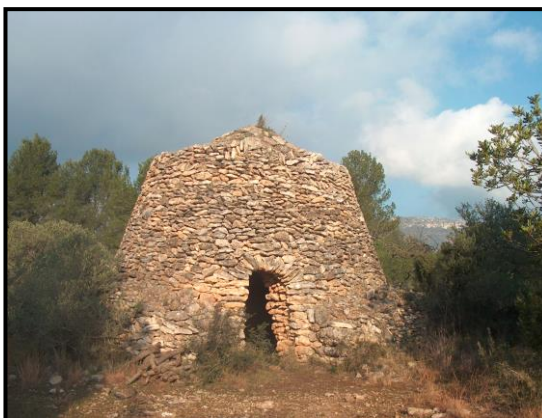
Barraca dels Comuns del Pellicer

El conjunt de barraques del terme municipal de Mont-roig van ser, en una primera fase, incloses en el "Catàleg de béns protegits" ("B.26") del POUM (Pla d'Ordenació Urbanística Municipal), segons l'article 69 DL 1/2005, la qual cosa ja suposava un primer nivell de protecció. La seva aprovació dins del POUM ja comporta, també, la de la Comissió d'Urbanisme de la Generalitat a Tarragona, en data del 30-11-2006 (Llei